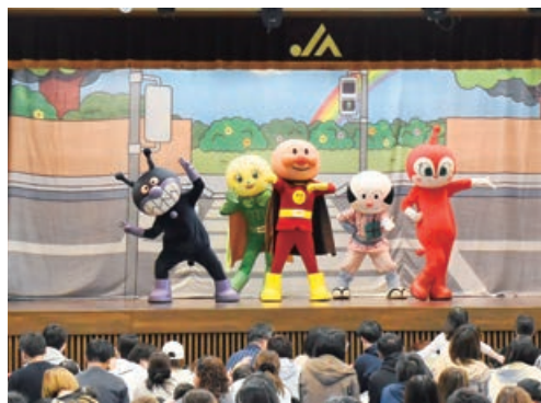
▲アンパンマンたちと楽しく交通ルールを学びました