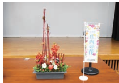
▲クリスマスカラーを意識した素朴な作品となりました