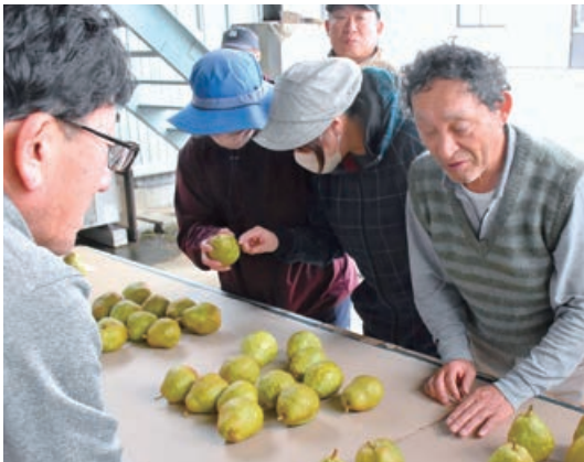
▲規格確認だけでなく、生産者同士の貴重な情報交換の場でもあります

JA庄内みどり刈屋梨出荷組合は10月31日、当JAの北部選果場で刈屋梨ラ・フランスの目ぞろえ会を行いました。生産者やJA職員、市場関係者ら15人が参加し、選別・梱包方法など出荷規格を確認しました。