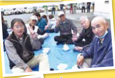
よねさんの紙芝居!