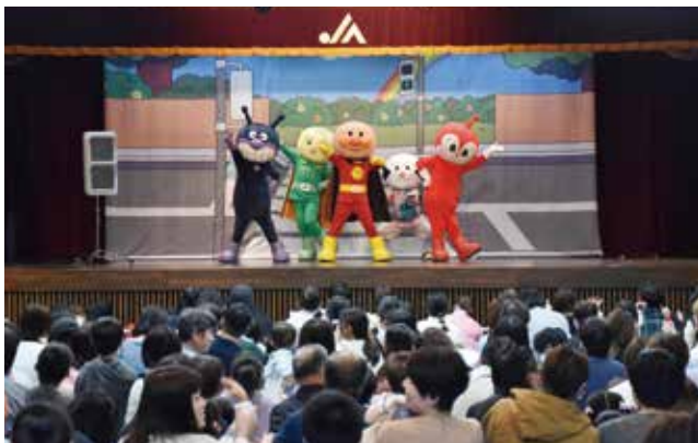
▲ 交通ルールを楽しく学びました ©やなせたかし/フレーベル館・TMS・NTV

JA庄内みどりは10月14日、当JA本所で「JA共済アンパンマン交通安全キャラバン」を開きました。5年ぶりの開催となった今回は午前と午後の2回に分けて行われ、延べ500人の親子連れが参加しました。