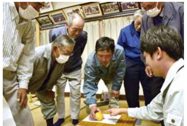
▲柿の規格を確認する組合員

管内では、143人が43haで「刀根早生」と「平核無」を栽培。今年は新型コロナウイルスが5類に移行したことを受け、店頭食品販売を中心に展開していく予定です。刀根早生は10月下旬、平核無は11月中旬にそれぞれピークを迎える見通しです。