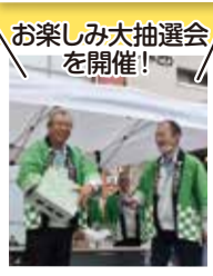
お楽しみ大抽選会を開催!