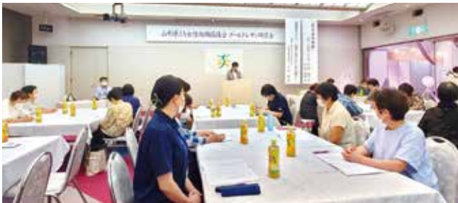
▲快眠セミナーを受ける参加者