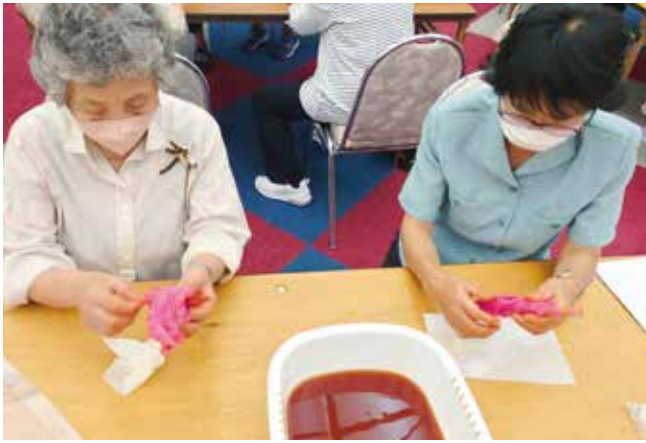
▲紅茶染めを体験する参加者

ゴールドレディ研修会は、学習・交流を通して、地域における活動の活性化や生きがいづくり、仲間づくりを図ることを目的としています。