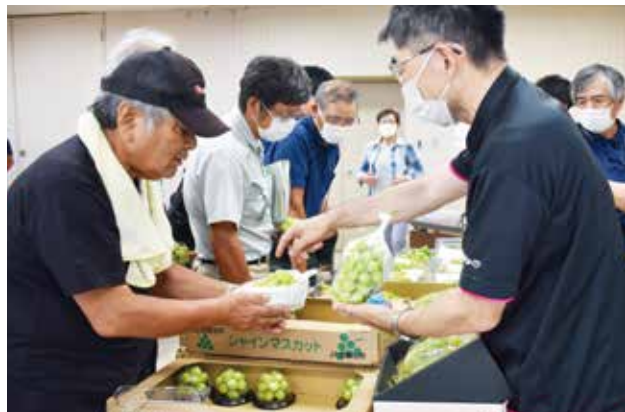
▲サンプルで出荷規格などを確認

今年は高温乾燥が続く、一部園地では葉焼けなどの被害が見受けられましたが、糖度も高く程よい酸味が感じられる順調な仕上がりととなっております。9月下旬から10月中旬にピークを迎え、11月上旬まで出荷が続きます。