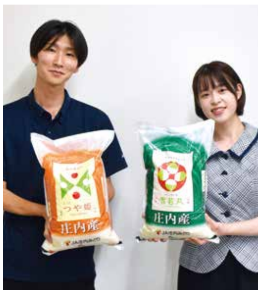
▲新しい米袋で当JA産米をPRします！