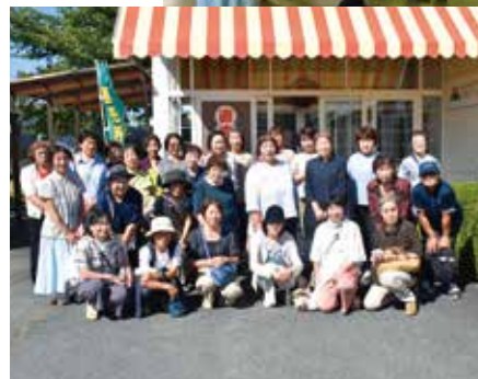
◀直売所「マルのん」にて記念撮影