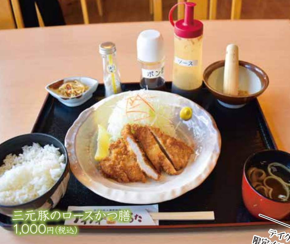
三元豚のロースかつ膳 1,000円(税込)