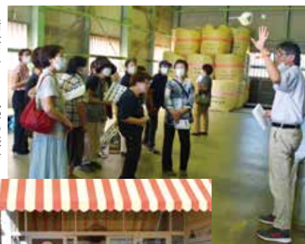
▶精米センター見学の様子