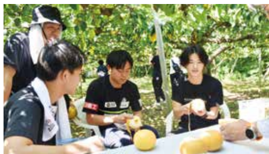
▲産地研修を楽しむ神奈川大生たち