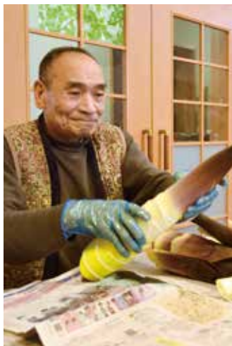
▲手際よく調理をしている利用者

グループホーム結いでは5月12日、旬の孟宗を使った孟宗汁作りを行いました。孟宗はJA福祉課の職員が遊佐町で朝採りしたものを使用。採りたての新鮮な孟宗を調理し、温かい孟宗汁を利用者9人と職員4人とで囲み、春の味覚を味わいました。 献立は孟宗汁と筍ご飯、キャベツの梅肉和え、ミカンの牛乳寒天の計4品。利用者は、孟宗の皮むきやシタケ、厚揚げのカットなどできることを分担し、楽しく調理しました。利用者は「みんなで仲良く孟宗汁を作るのが楽しみだった」「孟宗が柔らかくておいしい」と笑顔で感想を述べていました。