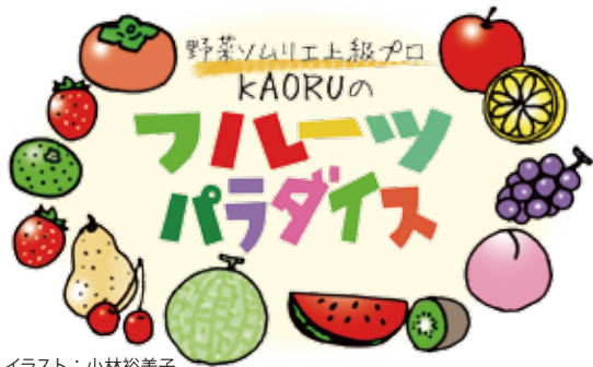
イラスト：小林裕美子