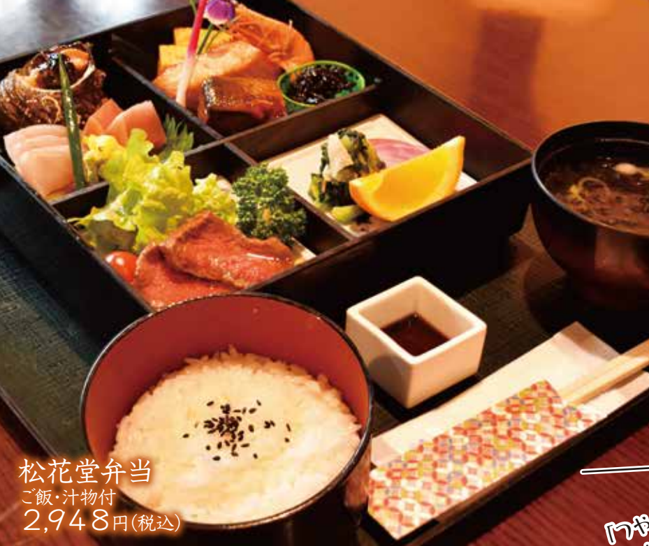
松花堂弁当 ご飯・汁物付 2,948円(税込)