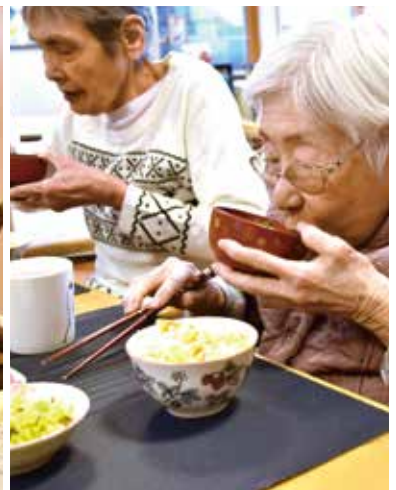
▲おいしそうに孟宗汁をたべている利用者