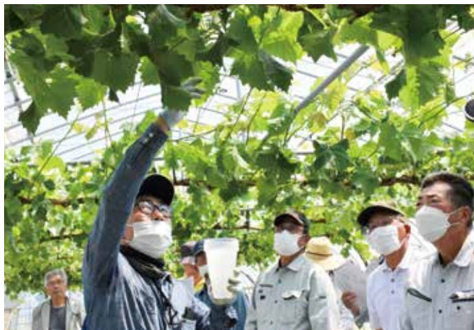
▲ ジベレリン処理は種なしぶどうにするために必要不可欠な作業です