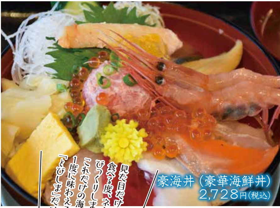
豪海井(豪華海鮮丼) 2,728円(税込)

見た目だけじゃないよ、食へ度、ネタのおこし、びびりしました。これだけの海産物を一度に味わえるのは「とびしま」だけですわ!