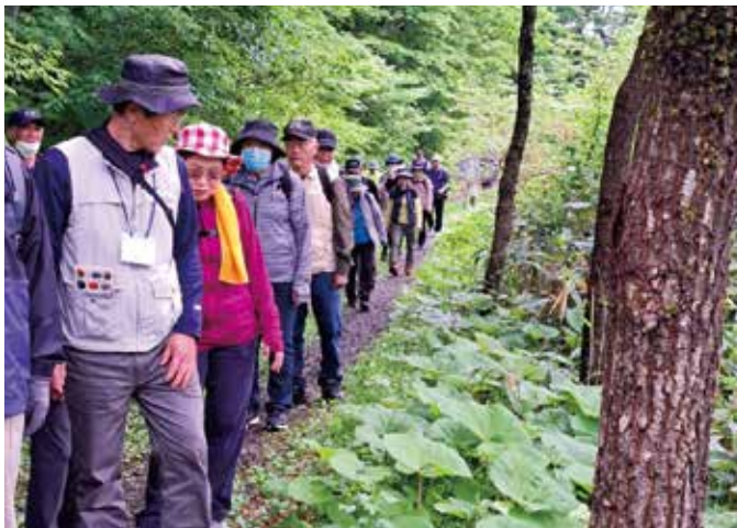
▲新緑に囲まれながらウォーキングを楽しみました

第2回目のウォーキング倶楽部が5月27日に開かれました。今回の「新緑の鳥海高原家族旅行村」コースは標高550mの鳥海高原にある日本グラウンドゴルフ協会認定の公認コースです。 会員58人と職員2人の総勢60人の参加者はウグイスのさえずりを聞きながら色鮮やかなピンク色のタニウツギの花やワラビなどの山菜を見つけたり、鳥海山から流れる溪流に川魚を見つけたりと新緑の鳥海高原のウォーキングを楽しみました。 ウォーキング倶楽部ではJA管内の見どころを季節ごとに紹介できるように設定しており今年度は全7回開催を予定しています。