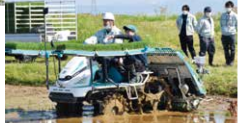
▲農家組合員の頼りとなる営農指導員に育てていきます