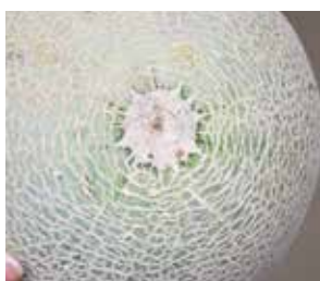
▲ここがおしり（花落ち）部分

メロンの食べごろはおしり（花落ち）に弾力が出てきたら。そして表面の青みが取れて模様（ネット）が均一でくっきりとなり、ツルがしおれてきたら食べごろとされています！