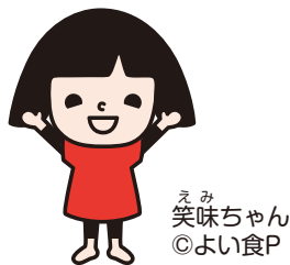
えみ 笑味ちゃん

冷やしすぎると甘さが落ちてしまうので、食べ頃になるまでは室温で保管して、食べる前に冷やすのがおすすめです。おいしい「庄内砂丘メロン」をもっとおいしく食べてね!